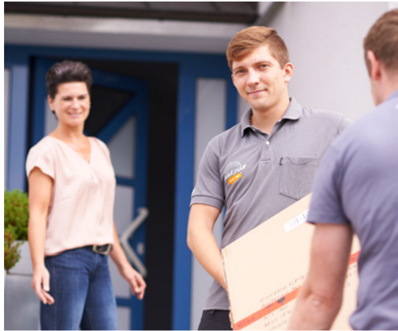
Zufriedene Kunden durch 2-Mann-Handling